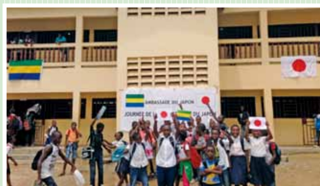
ガボン共和国 2013年度「シャルボナーージュ小学校増築整備計画」