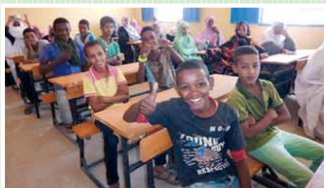
モーリタニア・イスラム共和国 2015年度「シェガル市第一小学校整備計画」

これからも「KU・SA・NO・NE」の種を広げ、世界中に幸せの花を咲かせていきます。