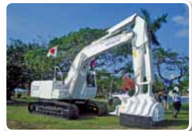
コロンビア共和国 2009年度「メタ県・トリマ県 対人地雷除去機材整備支援計画」