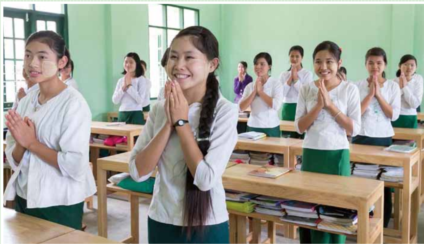
ミャンマー連邦共和国 2013年度「シャン州クンロン地区クンロン小中高等学校建設計画」